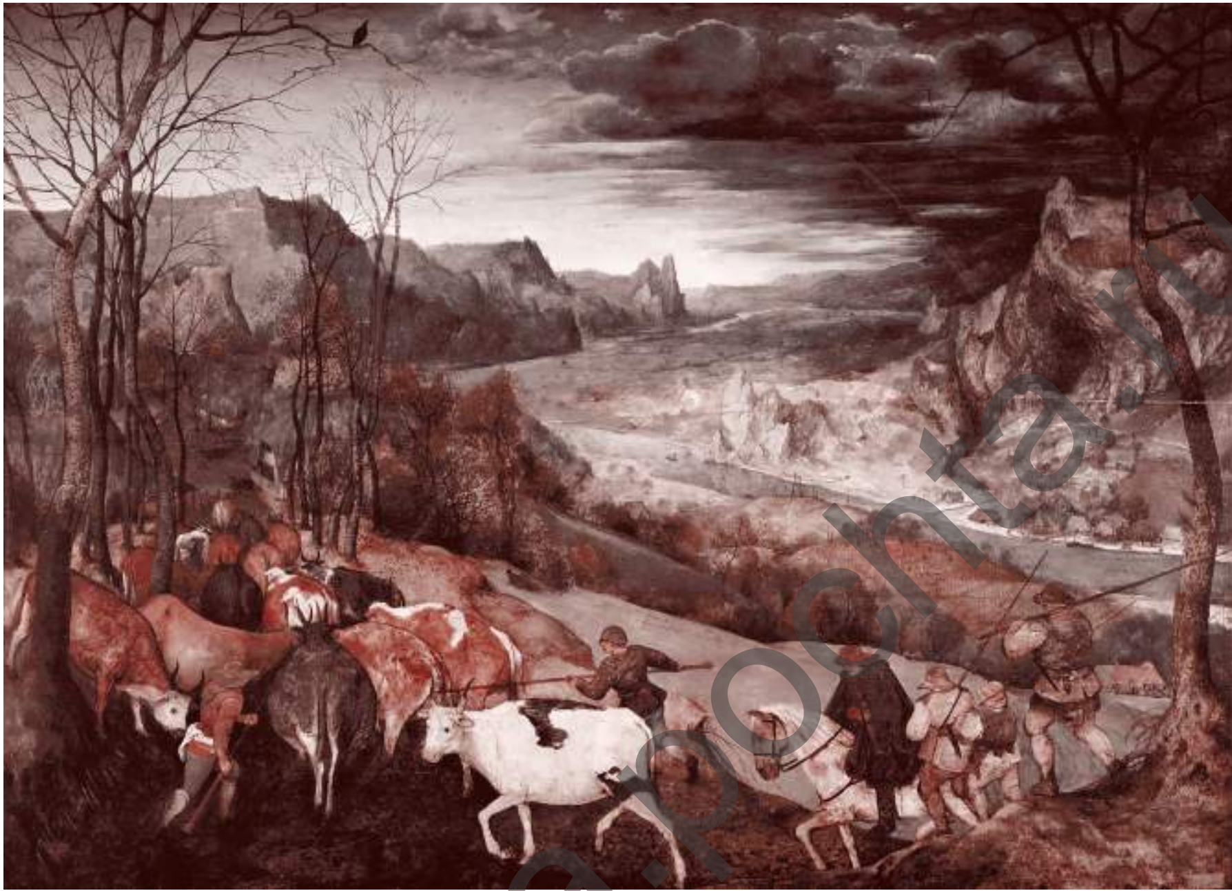
Питер Брейгель Старший. Возвращение стада. 1565

чательную победу над Россией. Запад, по-прежнему находясь в доле с нашим отечественным элитным коллективным регрессором, наваривает на регрессе колоссальные средства. Но даже эти средства вторичны по отношению к проблеме будущего господства над миром.