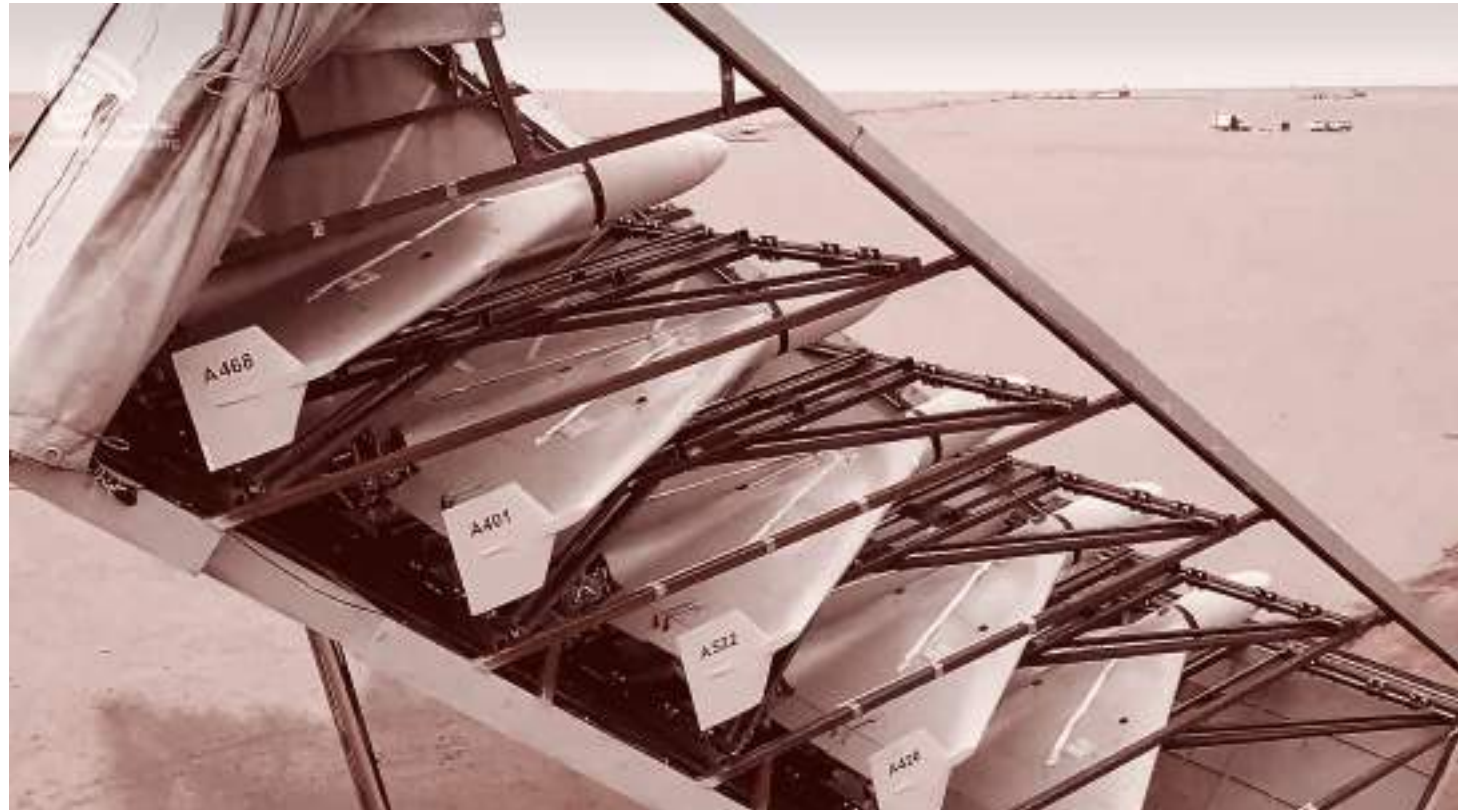
Пусковая установка с иранскими барражирующими боеприпасами Shabed-136

Изначально его разработкой занимались украинские военные по указанию президента Владимира Зеленского. Они предложили провести «широкое наступление» на юге, чтобы вернуть Херсон и отрезать Мариуполь, однако часть украинских военных и американских чиновников сочли, что это приведет к слишком большим потерям ВСУ. Тогда украинское командование на-