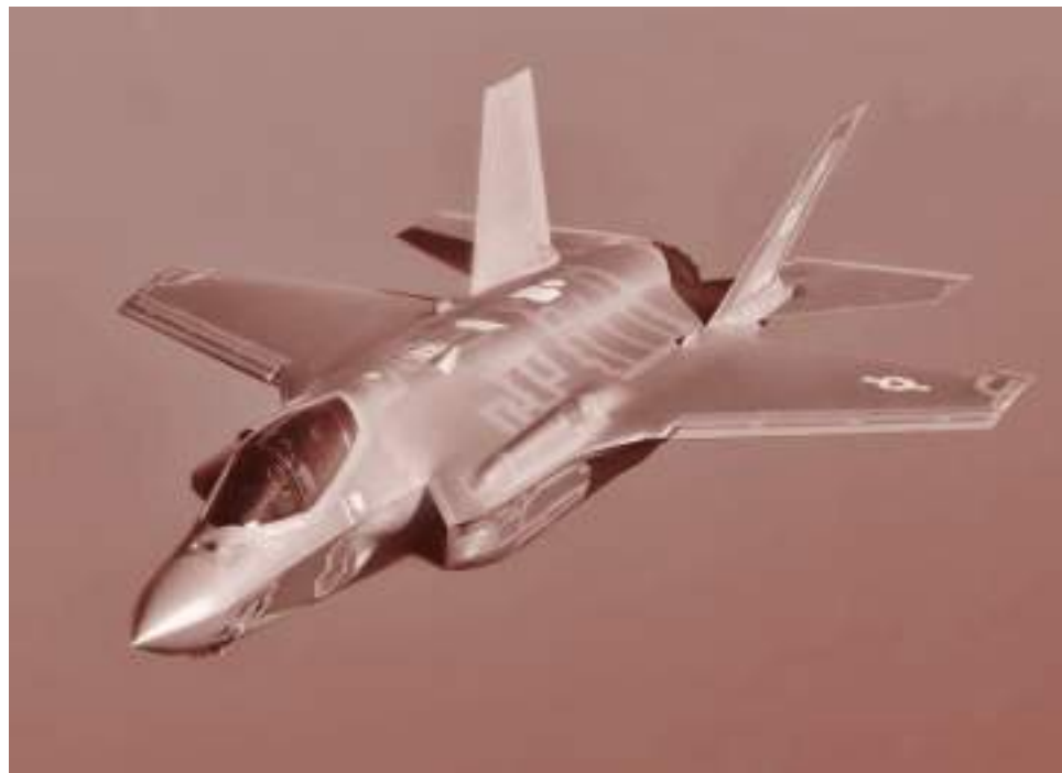
Истребитель США F-35. 2013