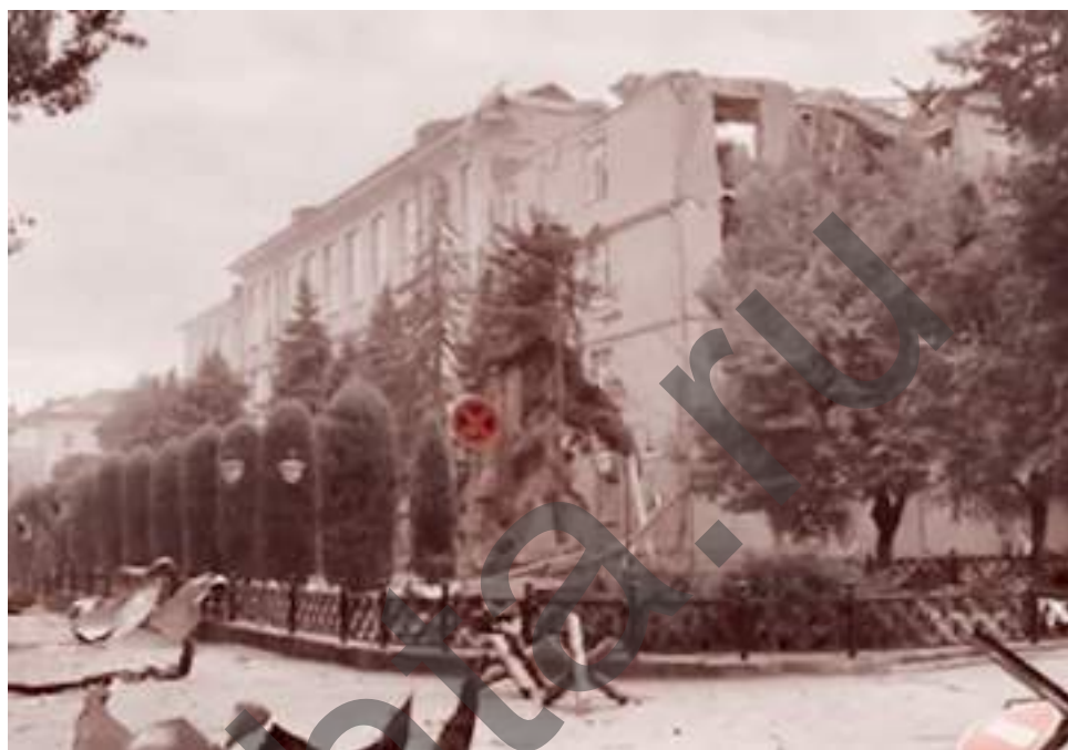
Здание администрации Херсонской области после обстрела. 2022

Ракетный обстрел украинскими войсками центра Херсона произошел утром, ракеты попали в здание администрации Херсонской области. По меньшей мере один человек погиб, несколько ранено, сообщили ранее власти региона.