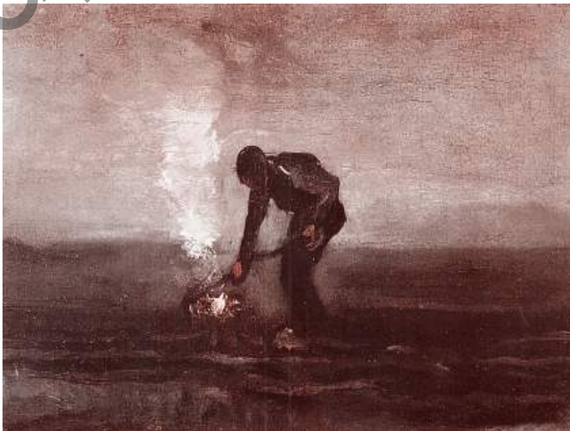
Винсент Ван Гог. Крестьянин, сжигающий сорняки. 1853–1890