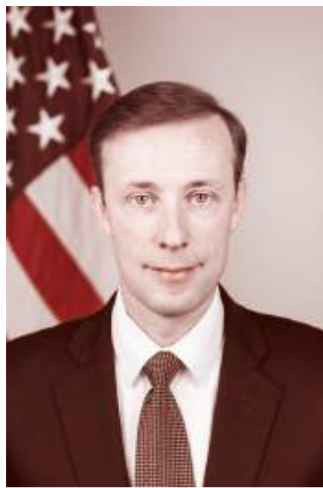
Советник президента США по национальной безопасности Джейк Салливан

Мобилизационные мероприятия начнутся уже с сегодняшнего дня. Губернаторам поручили обеспечить призыв в количестве и в сроки, которые Минобороны определяет для каждого региона.